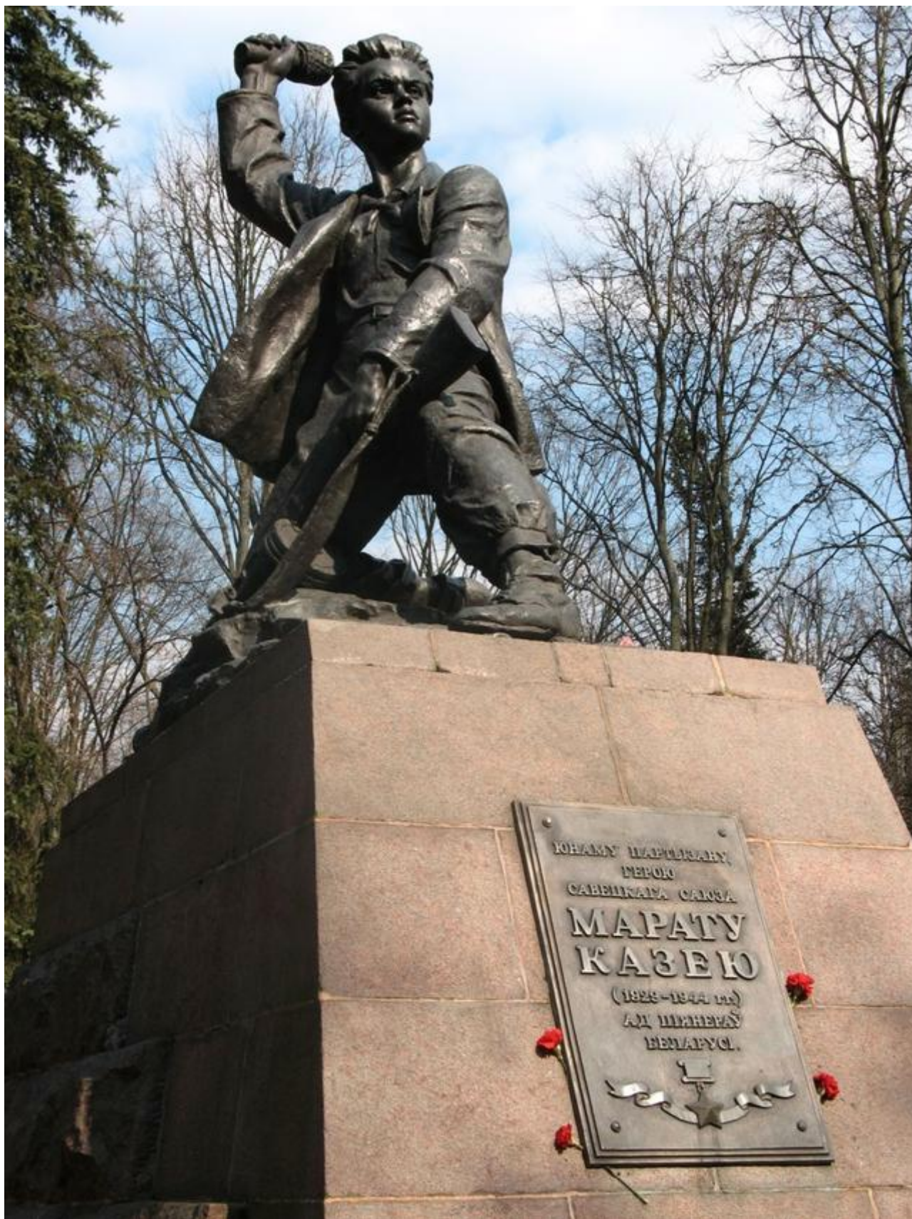
Марат Казей (памятник в Минске)