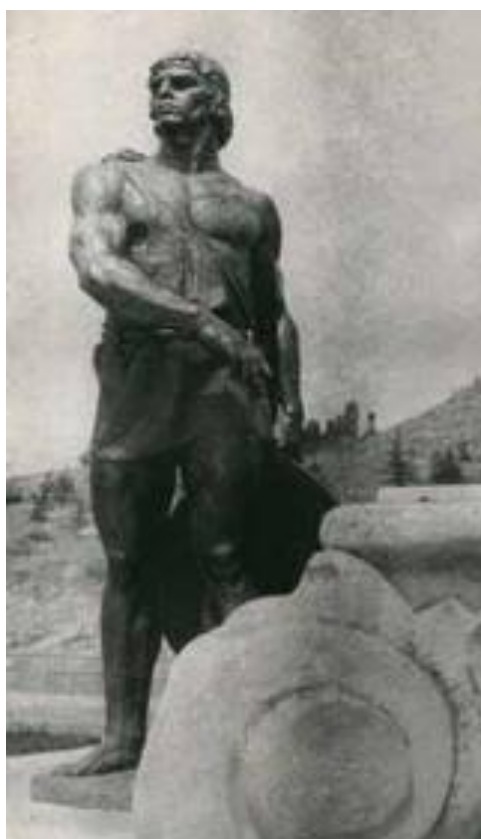
Спартак (памятник в Болгарии)