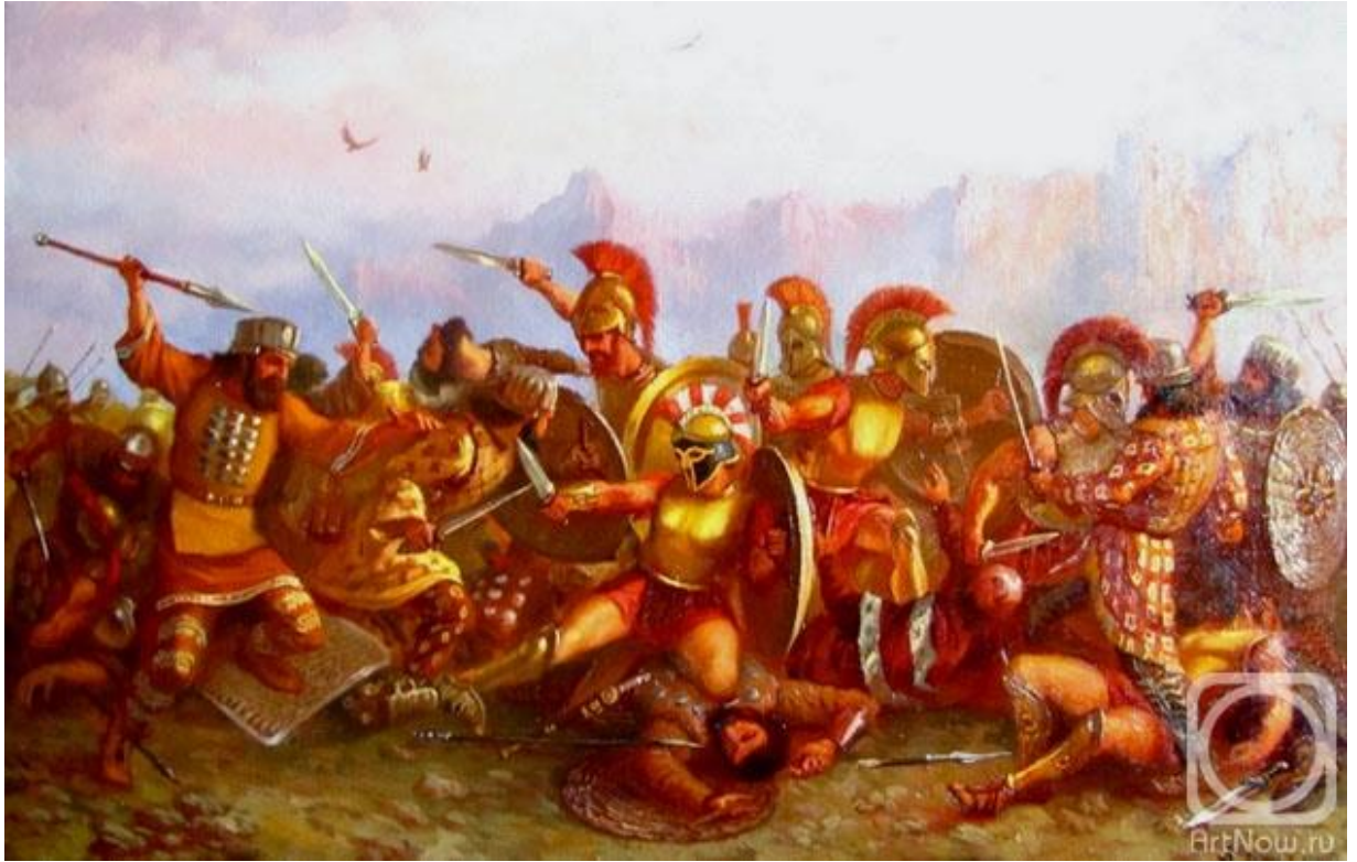
Бой спартанцев с персами