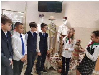
Кандраценкі“ Тыдзень роднай мовы.

Кожны грамадзянін Рэспублікі Беларусь ганарыцца сваёй гісторыяй, ведае і шануе сваю родную мову. Вучні I – XI класаў прынялі актыўны ўдзел ва ўсіх мерапрыемствах, якія ладзіліся падчас Тыдня ў гімназіі. А іх было нямала: акцыя “Размаўляй са мной па-беларуску”, прэзентацыя віншавальных паштовак “Пажаданні роднай мове“, гастронамічны фэст