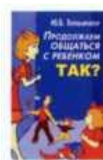
Юлия Гипперейтер «Продолжаем общаться с ребенком. Так?» АСТ 2008.