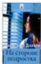
Франсуаза Дольто «На стороне подростка» У-Фактория, 2004.

Итак, вы располагаете набором подсказок для жизни с ребенком. Но помните, что овладение любыми новыми навыками требует времени. Первым делом забудьте о чувстве вины. Наблюдайте, не осуждая, какие результаты приносят ваши воспитательные усилия, и вы сможете учиться на своих ошибках. Чтобы поддержать вас в этом начинании, мы рекомендуем вам книги, которые помогут обрести новый взгляд на воспитание. Счастливого пути!