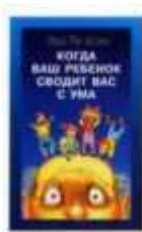
Эда Ле Шан «Когда ваш ребенок сводит вас с ума» Прайм-Еврознак, 2006.