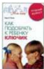
Хаим Г. Гинот «Как подобрать к ребенку ключик. Трудный возраст» Центрполиграф, 2008.